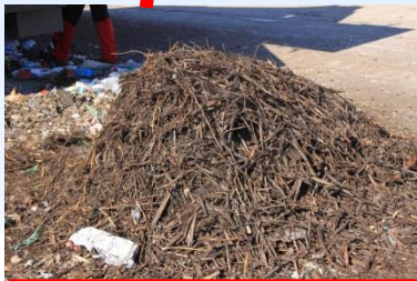
Überkorn (z. B. Heizmaterial)