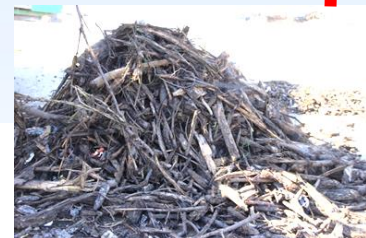
Holzfraktion für BHKW