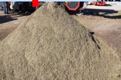
Siebfraktion 0- 10 mm bis 0 - 25 mm

Selbstreinigende Siebdecks Eigener hydraulischer Fahrtrieb