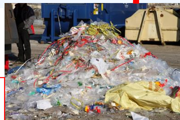
Folienfraktion aus Biomüll